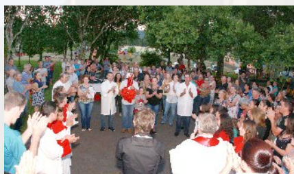
Peregrinação de Cristo Rei - Nova Concórdia | 21-11-2018