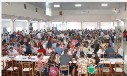
Festa de Cristo Rei | 25-11-2018

A palavra é: Gratidão a todos que participaram!