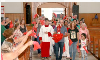
Chegada de Cristo Rei na Matriz | 22-11-2018