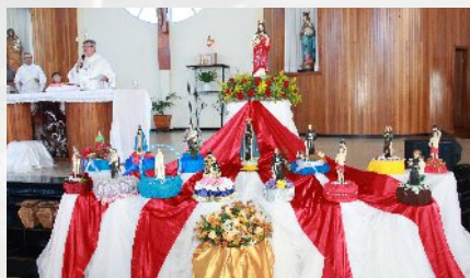
Missa da Festa de Cristo Rei | 25-11-2018