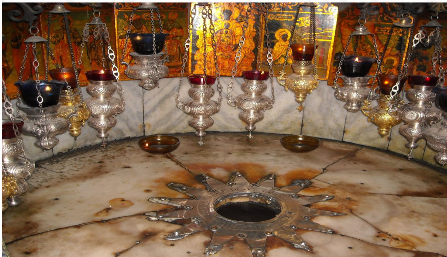
Estábulo - lugar onde Jesus nasceu, em Belém

O Natal conta a história da família mais importante do mundo, a Sagrada Família, Jesus, Maria e José, exemplo de amor, união e humildade para toda a humanidade.