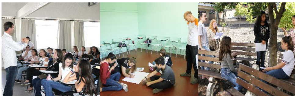
Formação com catequizandos da 4ª fase.