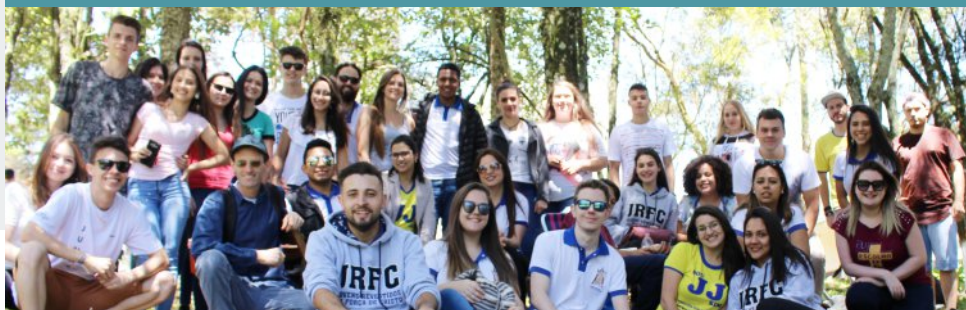
Grupo de Jovens JRFC - DNJ 2018