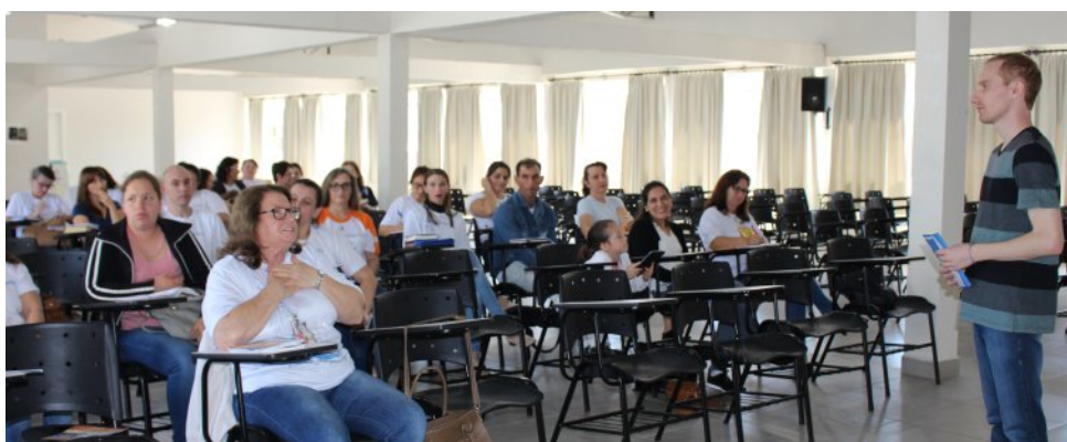
Formação com catequistas sobre o documento 107: Iniciação à vida Cristã