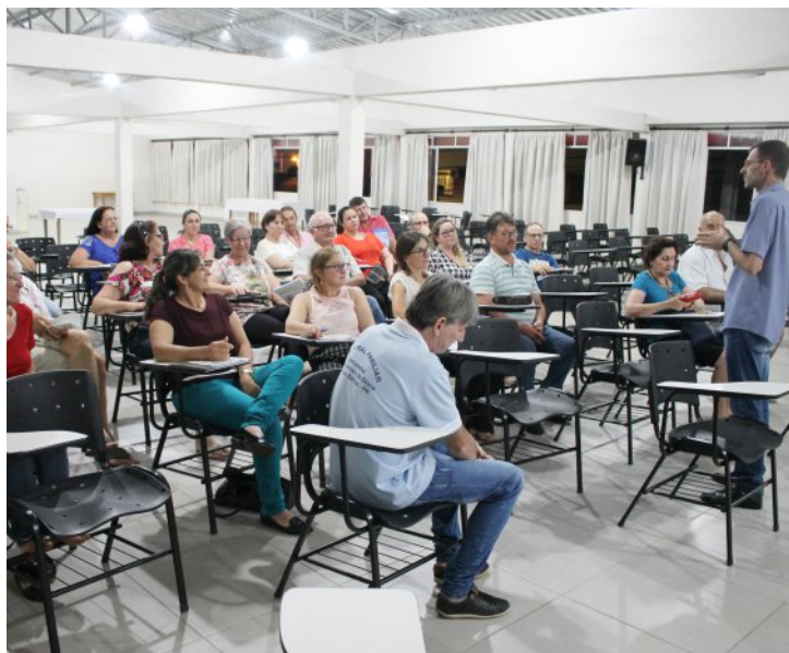
Formação dos agentes da Pastoral do Batismo.