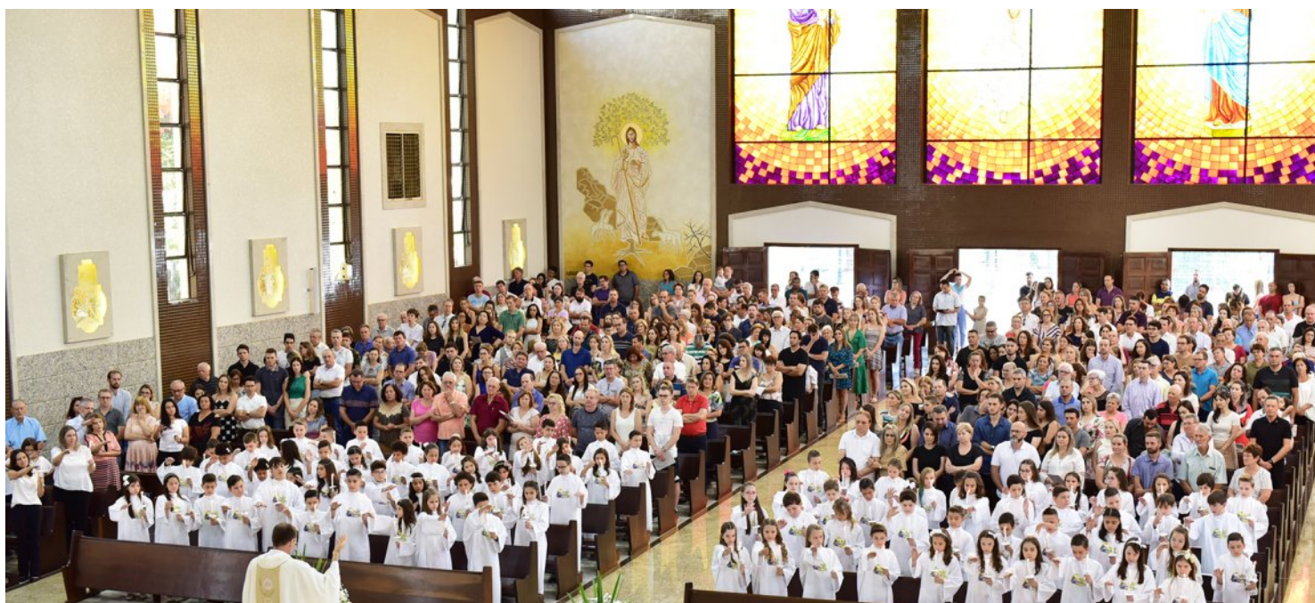
Dia 24 de novembro, aconteceu a Primeira Eucaristia na Matriz - 86 crianças.