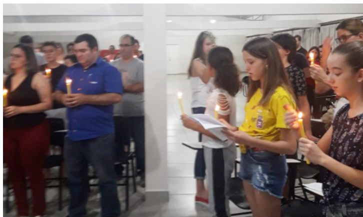
No dia 18 de novembro, os catequizandos da 5ª fase prepararam a Celebração da Luz e convidaram seus pais/responsáveis para participarem deste momento, envolvendo dessa maneira catequese e família.